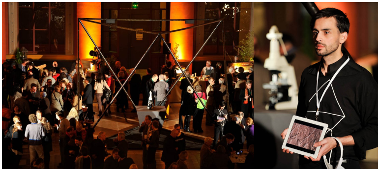
Abb. 6a. & 6b: Sabine Kacunko, BOOTSCHAFT- Crystal Mirror, Medienskulptur, École nationale supérieure des Beaux-Arts de Paris (ENSBA) 2011

Klänge ausgegeben und weiter kommuniziert (vgl. Kacunko Bootschäften Online ).