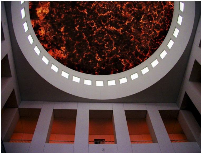
Abb. 2: Sabine Kacunko, Bloody Moon. Kunstpalast Düsseldorf 2003

Mit ihrer Closed Circuit Videoinstallation "Product of Life" (2002) [10] setzte Sabine Kacunko den wohl ranghöchsten Themenkreis ihrer Kunst ab, den Kreis in dem "das lebendige Licht" (Hildegard von Bingen) nun zum ersten Mal auf die Mikroebene heruntergeholt worden war. Es handelte es sich um eine interaktive Großbildinstallation, die aus einem 400 cm hohen und 160 cm breiten Diapositivmaterial bestand. [11] Als Motiv wurde ein Schweineschädel gewählt, eine großformatige Schwarzweiß-Fotoarbeit der Künstlerin ("Schädel", 1997), dessen Negativ durch Besiedelung von Bakterien dem Verfall ausgesetzt wurde. Dieser - ein innewohnendes medienpädagogisches Potential tragende - Akt der Besiedlung des vermeintlich Toten durch das vermeintlich Lebende kann als der Anfang der Bakterienkunst von Sabine Kacunko bezeichnet werden. Der in Gang gesetzte Prozess wurde mit Hilfe digitaler Bildtechnik dokumentiert, indem der Verfall des Negativen selbst von seinem Anfangsstadium bis zur fortgeschrittenen Zerstörung in Form von Diapositiven präsentiert wurde.