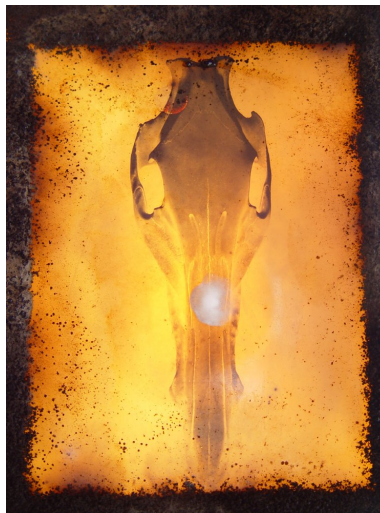
Abb. 1: Sabine Kacunko, Besiedeltes Negativ vom Wildschweinschädel mit Bakterien, Kunstverein Coburg 2003© Sabine Kacunko

Bakterienkunst: Ein Rückblick in die Zukunft der kunstbasierten Forschung und forschungsbasierter Kunst