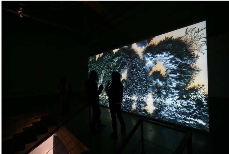
Abb. 4. Sabine Kacunko, Dry Sea. Interaktive Installation, Platform China Contemporary Art Institute Peking 2009

Der Mikrokosmos der von Anna Gorbuschina (BAM Berlin) gezüchteten Pilzkulturen der Wüstenpatina wurde auf eine Leinwand projiziert, aber je mehr Ausstellungsbesucher den Raum betraten, desto mehr schwand das Patina-Bild, desto weniger von dem ursprünglichen ökologischen wie auch ästhetischen Gleichgewicht blieb bestehen.